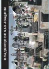
КЛАДБИЩЕ ДЕ САО ЖОАУИМ

Зона вулканической активности — геотермальная зона, известная и популярная для купания и приготовления пищи на острове Lago das Furnas.