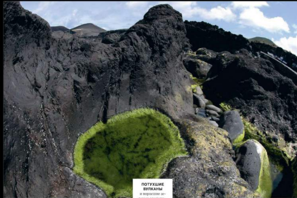
ПОТУХШИЕ ВУЛКАНЫ и поросшие лишайю кратеры — часть традиционного местного пейзажа.