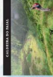
CALDEIRA DO FAIAL